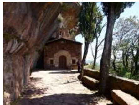
Interior de l'ermita de l'Abellera

L'ermita de l'Abellera possiblement data del 1570. Té una disposició força estranya, ja que s'assenta a l'interior d'una balma. La seva