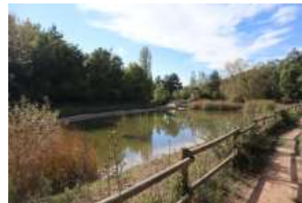
Llac de la Roca Foradada

És una gran roca de gresos vermells, erosionada per l'acció del vent. De perquè les roques de Prades són tant vermelles, en parlarem a la quarta sortida d'aquest cicle. Al seu costat hi trobem el Llac de Prades o Llac de la Roca Forada que és un petit embassament. També hi ha una zona de picnic i una font.