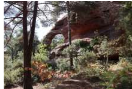
Roca Foradada de Prades

És una gran roca de gresos vermells, erosionada per l'acció del vent. De perquè les roques de Prades són tant vermelles, en parlarem a la quarta sortida d'aquest cicle. Al seu costat hi trobem el Llac de Prades o Llac de la Roca Forada que és un petit embassament. També hi ha una zona de picnic i una font.