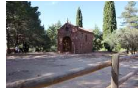
Ermita de Sant Antoni

Anomenada també la Vila Vermella pel color de molts dels seus edificis construïts amb gresos vermells. Està situada en un altiplà a uns 950 m d'altura enmig del Massís de les Muntanyes de Prades. Com indrets destacables cal anomenar la Plaça Major – amb l'església i la font –, el Portal de Prades amb la Creu de Sant Roc, el Portal del Planet del Pont i el Castell i, a les afores, l'ermita de Sant Antoni.