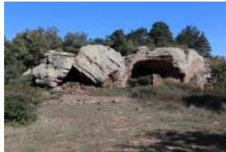
Cova d'en Pere