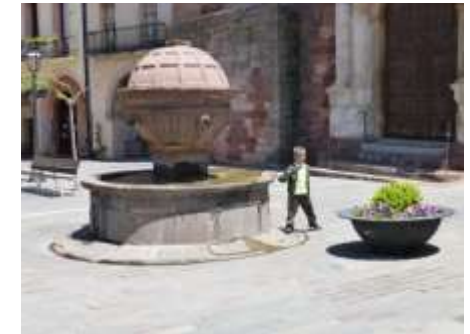
Font de la Plaça Major

Anomenada també la Vila Vermella pel color de molts dels seus edificis construïts amb gresos vermells. Està situada en un altiplà a uns 950 m d'altura enmig del Massís de les Muntanyes de Prades. Com indrets destacables cal anomenar la Plaça Major – amb l'església i la font –, el Portal de Prades amb la Creu de Sant Roc, el Portal del Planet del Pont i el Castell i, a les afores, l'ermita de Sant Antoni.