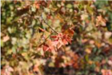
Fulles d'auró negre

En aquesta roureda també trobarem d'altres espècies com el grèvol, el castanyer, el trèmol, el pi roig, els aurons, l'alzina, l'avellaner, el teix, l'arboç, l'arç blanc ..., que explicarem a les activitats de natura. Algunes d'aquestes espècies són caducifòlies i donen tonalitats groguenques i vermelloses al bosc, a la tardor.