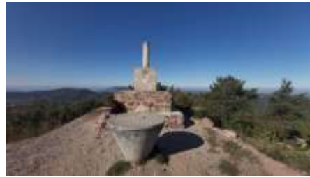
Cim del Tossal de la Baltasana

Cim comarcal del Baix Camp i de la Conca de Barberà amb 1201m. També és el punt més alt de les Muntanyes de Prades. Té una bona panoràmica envers la vila de Prades i les serres de la Mussara, de la Gritella i el Montsant. En dies clars es poden veure els cims del Pirineu. Un dels inconvenients d'aquest punt és l'antena i el seu generador. Hi podem accedir per un corriol que ve de l'oest o per una pista forestal des de l'Est