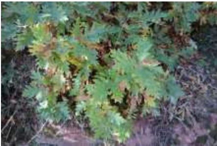
Fulles de roure reboll

Vegetació de muntanya humida caracteritzada per la presència del roure reboll ( Quercus Pyrenaica ). El nom reboll procedeix de la paraula llatina "repullus" que significa rebrot. Ja que aquesta una de les maneres de reproduir-se aquesta espècie. Sovint, els rebrotos són provocats per l'home quan talla l'arbre.