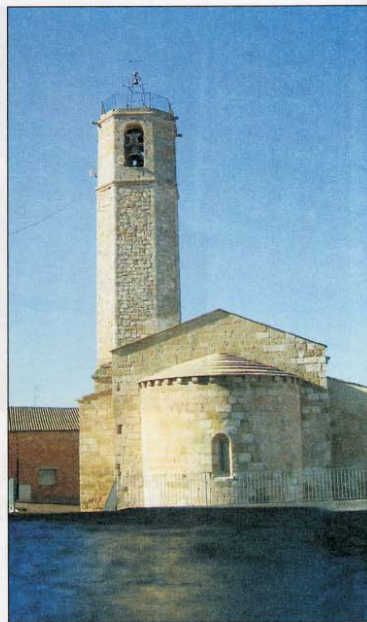
Vilanova de la Sal és un modest llogarret protegit a recer de la serra de Mont-roig. Segurament l'ermita més concorreguda de la zona és la de Montalegre que domina tota la vallada. El seu accés fou ja descrit, dins d'aquesta secció, el 7 de gener de 2005 en l'ascensió al cimadal del Mont-roig. Avui volem detallar l'accés a les ermites de Sant Miquel de la Privà, del Sant Cap i la de Santa Margarida de la Privà. Són tres bells exemplars de factura romànica que resten amagadíssims en els serrals reservats als trescadors.

1 h. 10 min. La pista tomba a la dreta, baixant;