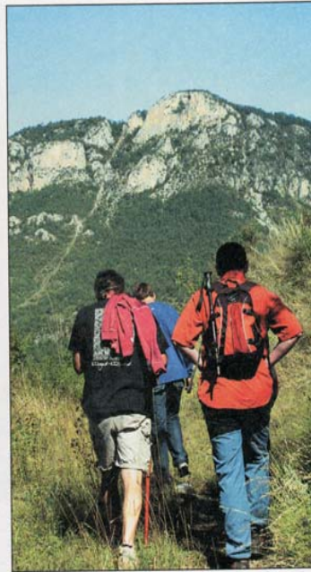
A dalt, imatge de Tuixent i un moment de la caminada. A sota, imatge de Santa Margarida, de gran devoció entre els gosolans, i d'una piona de la llum. Paratge solitari que antigament era poblat únicament els mesos d'estiu. Per a més informació, consultar el llibre 'El Coll de Tuixent' de la col·lecció La Guia negra de l'editorial La Comarcal Publisher.

1 h 35 min Revolt dels Fanerals. Uns metres més amunt surt el camí, molt perdut, que puja a per l'Obaga de les Costasses.