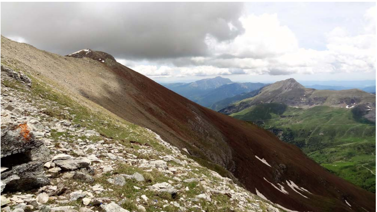
La forta pendent durant la pujada.