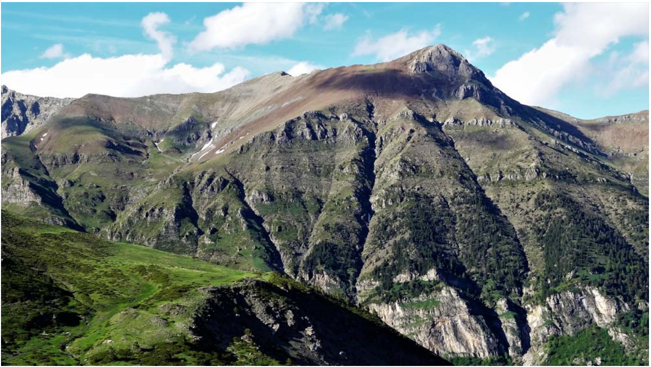
Vista del Tozal de Bocs des del coll de Sahún.

Avis Legal: En compliment de la LLEI 15/1999 de 13 de desembre, de Protecció de Dades de Caràcter Personal, l'informem que les seves dades personals seran introduïdes en el nostre fitxer de FICHESOCIS automatitzat de dades personals, amb la finalitat de: Gestió d'activitats associatives, culturals, recreatives, esportives, socials i realitzar fotos per al lloc web del Centre. Pot exercir els seus drets d'accés, modificació, cancel·lació, oposició i revocació d'aquestes dades, a l'adreça: C\ COMERÇ 25 amb codi postal 25007 de LLEIDA o a cel@cel.cat