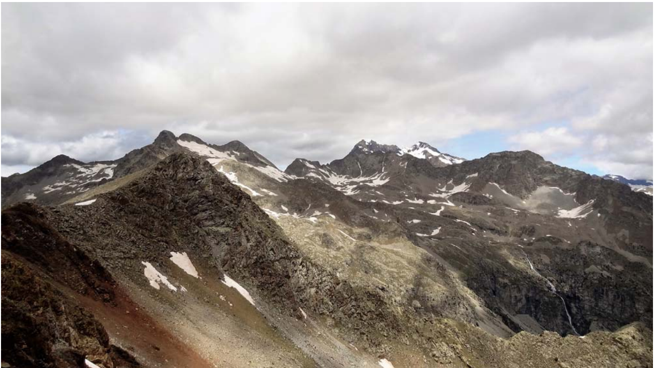
Vista del macís de Posets.