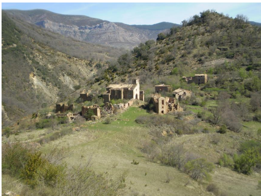
Iscles, un dels pobles abandonats de la vall

Avis Legal: En compliment de la LLEI 15/1999 de 13 de desembre, de Protecció de Dades de Caràcter Personal, l'informem que les seves dades personals seran introduïdes en el nostre fitxer de FICHESOCIS automatitzat de dades personals, amb la finalitat de: Gestió d'activitats associatives, culturals, recreatives, esportives, socials i realitzar fotos per al lloc web del Centre. Pot exercir els seus drets d'accés, modificació, cancel·lació, oposició i revocació d'aquestes dades, a l'adreça: C\ COMERÇ 25 amb codi postal 25007 de LLEIDA o a cel@cel.cat