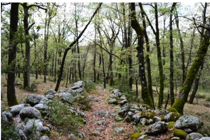
La roureda de Transàs

LLICÈNCIA FEDERATIVA . FEEC Modalitat: A