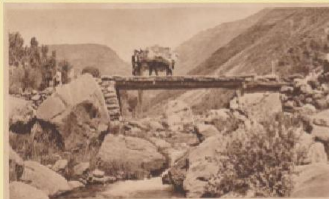
CAPDELLA. — Puente rústico sobre el Flamisell